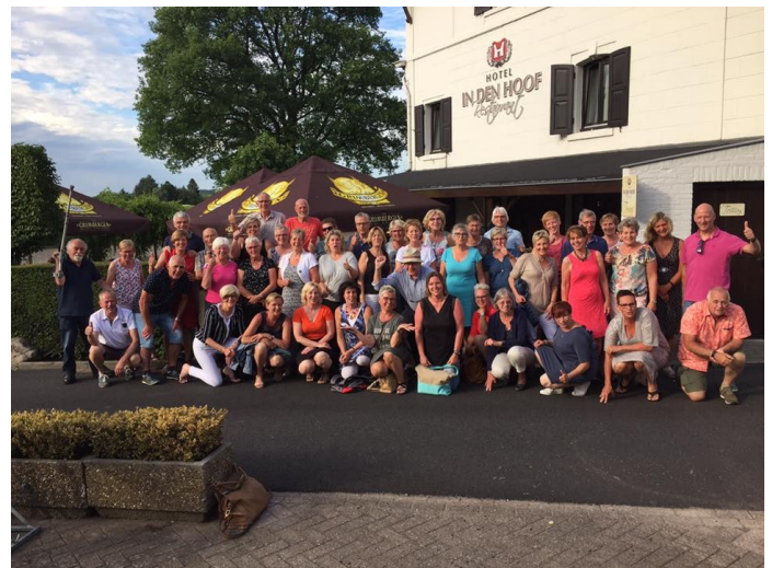
Kariboesweekend Maastricht juni 2017